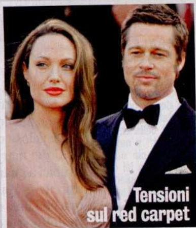
Tensioni sul red carpet

D'altra parte, è comprensibile che il presidente francese non dorma tranquillo, visto che la Bruni qualche anno fa dichiarava: «Non sono fedele. Mi tocca mentire spesso. Gli uomini prendono l'infedeltà femminile come un affronto personale».