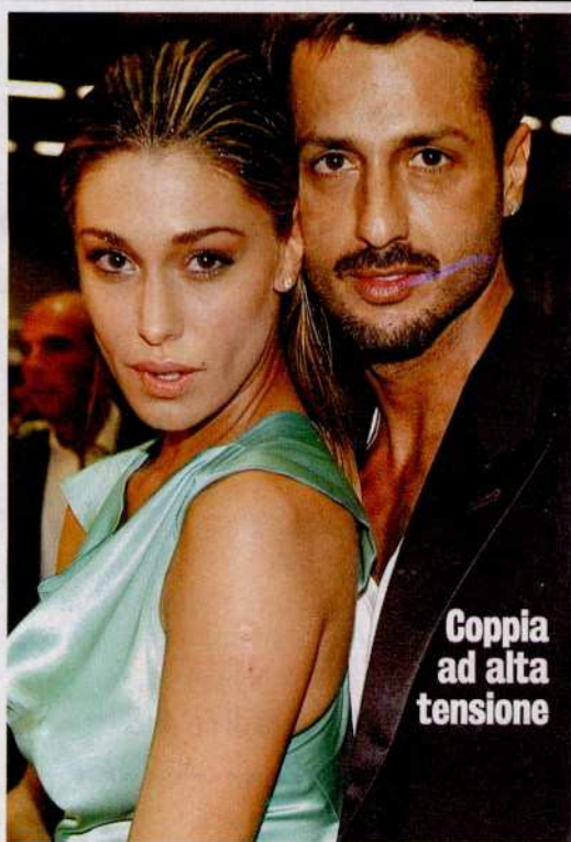
Coppia ad alta tensione

ALTA DIPLOMAZIA Parigi. Le immagini di Carla Bruni, 42 anni, con il marito Nicolas Sarkozy, 55: foto scattate sul set del film "Midnight in Paris" che hanno fatto parlare tutta la stampa di uno scoppio di gelosia del presidente (vedi "Diva" n.31/10). Lei era impegnata a recitare con Owen Wilson, 41 (con l'ex top a sin.).