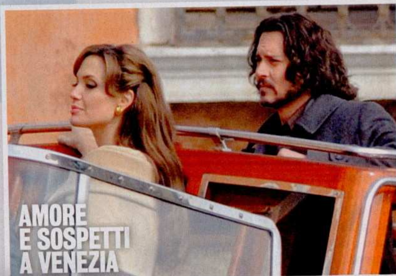
AMORE E SOSPETTI A VENEZIA

Brad Pitt, 46, giunto dagli Usa per controllare la situazione. Sotto, la coppia nel 2009 a Cannes; l'attrice è stata a sua volta gelosa dell'ex di Brad, Jennifer Aniston, 41.