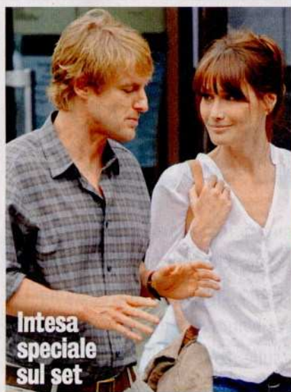
Intesa speciale sul set

Sembrava una passione fuori moda e invece... la gelosia colpisce anche i più potenti, belli e famosi: Nicolas Sarkozy, sotto pressione per l'esordio di Carla Bruni sul set con Owen Wilson, non è solo. «È un sentimento unisex che non fa distinzioni. Ma gli uomini faticano ad ammetterlo», sottolinea la psicologa