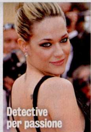
Detective per passione

TURBOLENZE D'AMORE Sopra, Robert Pattinson, 24 anni, e Kristen Stewart, 20, sono una giovane coppia affiatata, insieme sul set della saga "Twilight" e nella vita, ma ciò non impedisce a lei di temere di essere tradita. A sin., Laura Chiatti, 28, ha ammesso di fidarsi poco degli uomini.